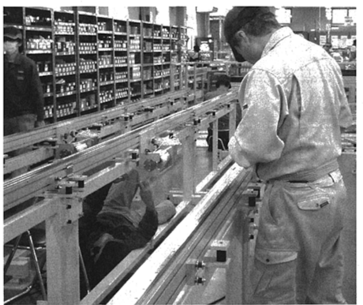
顧客ニーズをとらえたモノづくりが進む

新組織は若いアイデアをもとに発足した社内ベンチャー部門としても位置づける。新たな事業展開を具体的に示すことで、若手社員のベンチャー精神の醸成や高い志の育成につながる考えた。一方、人材面では、プロダクトデザインを専門にする人材を採用した。今まで以上に快適な使い勝手を實現するデザインで、さらに付加価値の高い製品提供が可能になった。