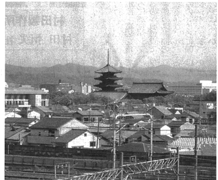
京都全景 京都を離れない理由がある