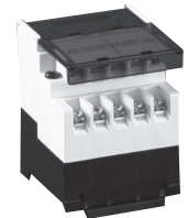
SD-120 ST-04* AD-(H)120 PT-04* など