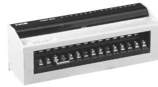
STV-(H)**T PTV-(H)**T など