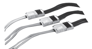
NAP-(H)04 NAS-(H)04 NAX-(H)04 など