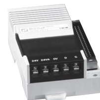
SCV(M)-(H)**T PCV(M)-(H)**T など