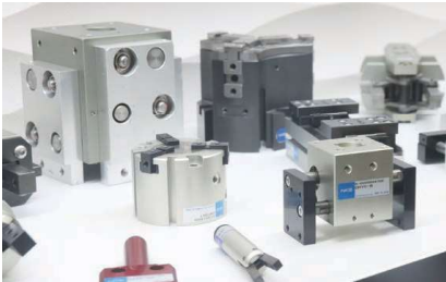
エアチャック等のエンドエフェクタやコンベヤを標準化してモジュールに。なお同社はエアチャックのバイオニアでもある

「モジュールは標準で300以上あるが、」 「簡単自動倉庫も開発...」 「ハードは完成済みで今は...」