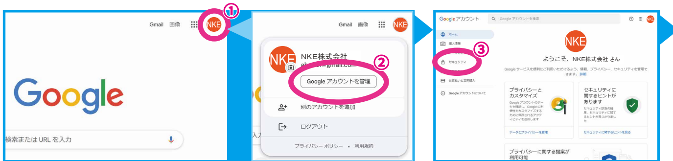
Googleのトップページの①アイコンを選択→②Googleアカウントを管理を選択→Googleアカウント管理画面の③セキュリティを選択

※Google 側で予告なく設定画面や手順が変更された場合、下記のものとは異なる恐れがございますがご了承ください。