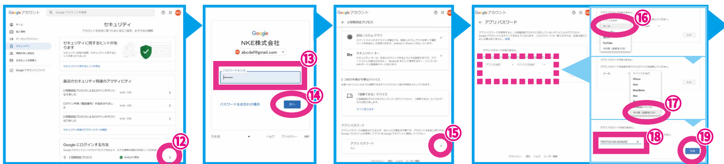
セキュリティの2段階認証プロセスの⑫>を選択→⑬パスワードを入力し、⑭次へを選択→アプリパスワードの⑮>を選択【アプリを選択】で⑯メールを選択し、【デバイスを選択】で⑰その他(名前を入力)を選択し、⑱適当な名前を入力し、⑲生成を選択