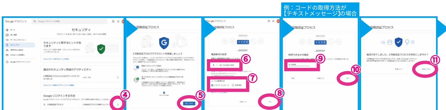
セキュリティの2段階認証プロセスの④>を選択→⑤使ってみるを選択→⑥電話番号・⑦コードの取得方法を入力・選択し、⑧次へを選択→⑨コードを入力し、⑩次へを選択→⑪有効にするを選択